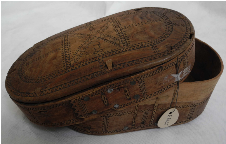
Fig. 8: Treeske (BME 2655) innkjøpt fra A.B. Wessel i 1917. «Hvor fjellapperne før i tiden oppbevarte sølv- og andre verdigjenstandene». Påført årstall «anno 1728».

Å bygge opp en komplett samisk samling var alltid målet også her ved Bergens Museum. Etter den store samlingen kom fra Jens Holmboe, og altså i hans direktørperiode, fikk museet i 1917 anledning til å kjøpe en ny samling av hundre samiske gjenstander fra Dr. Andreas B. Wessel (1858-1940). Samlingen kostet museet 450 kr og ble ansett å være av høy verdi.