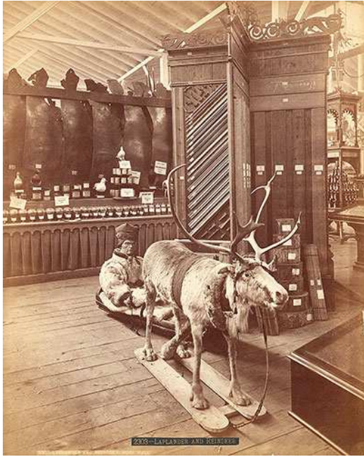
Fig. 4: Samisk innslag ved firmaet M.Thams & Co sitt podium under verdensutstillingen i Philadelphia i 1876