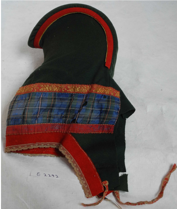
Fig. 6: Hornlue (BME 2292), muligens den som barnefiguren på bildet har på hodet under verdensutstillingen i Philadelphia 1876. Gave av F.G. Gade, v/ kjøpmann C.O. Fandrem.

Allerede i 1822 hadde man utstilling av både samiske folk, reinsdyr og fangstredskaper i London. I et stort bygg på Piccadilly, i det som ble kalt for «The Egyptian Hall» eller «Museum of Natural History and Pantherion» ble det bygget et stort vinterlandskap med fjelltopper og samiske telt og på veggene var utstilt samiske bruksgjenstander. En samisk familie med åtte reinsdyr var brakt over fra Finnmark 13 . I de neste tiårene var det også flere trupper av samer og reinsdyr som turnerte forskjellige zoologiske hager blant annet i Tyskland og Nederland 14 . Det var også levende samer med på verdensutstillingen i Paris i 1889 og i Chicago 1893.