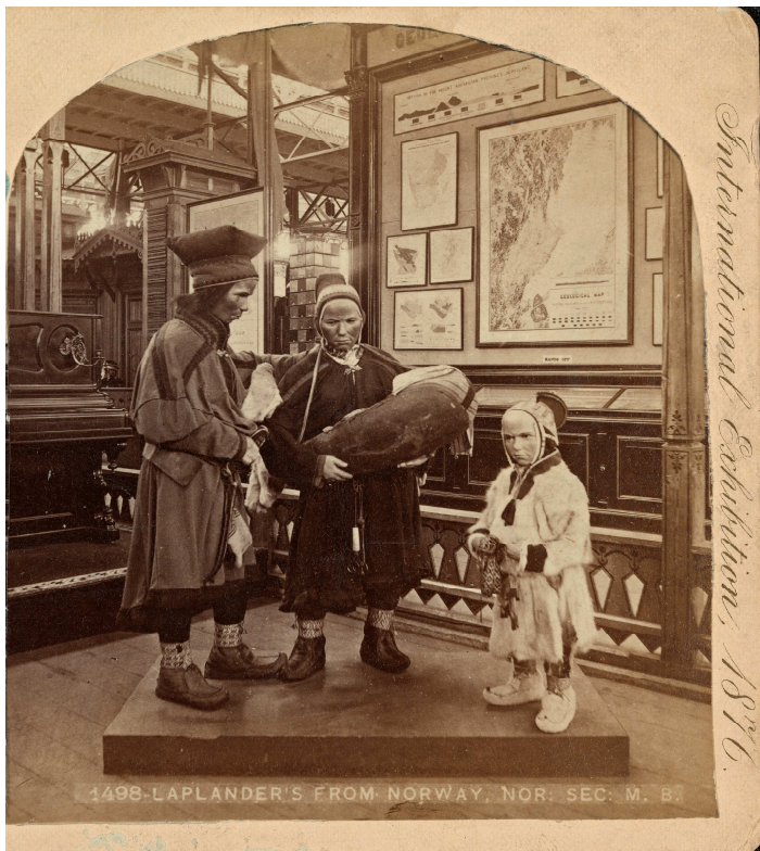
Fig. 5: Samepodium ved Norges avdeling i hovedbygning under verdensutstillingen i Philadelphia i 1876. Her kan vi studere in situ hvordan gjenstandene i våre samlinger først var utstilt med påkledde dukker. Dukkene, laget av en svensk kunstner, fulgte også med da disse gjenstandene kom til Bergens Museum, men de finnes ikke lengre i dag.